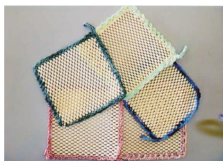
瓶のふた開けグッズ