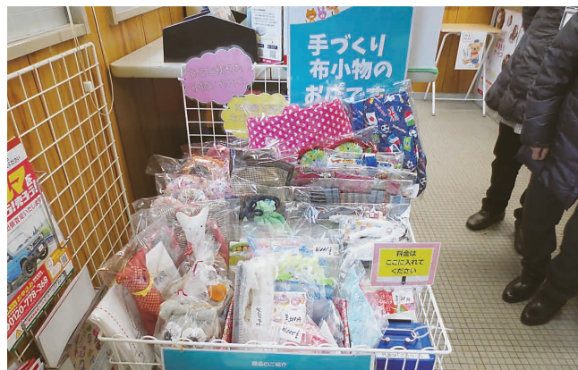
亀田袋津郵便局 小物販売の様子

昨年の12月から、女性会員が製作した小物の無人ワゴン販売を、市内の郵便局で実施しました。ワゴンは新潟米山郵便局(中央区)、小新南郵便局(西区)、亀田袋津郵便局(江南区)に設置され、商品の種類は会場となる区により異なりましたが100円~1,000円程度と買いやすい価格となりました。売上は各売場とも好評で品薄にならないよう担当者が定期的に搬入していました。