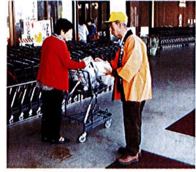
プラント5横越にて