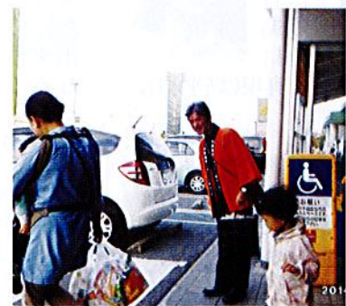
原信河渡シティーにて

今年もセンター事業普及啓発促進月間に合わせ、10月に街頭PR活動が新潟市内の19カ所で行われました。各地区では、のぼり旗の下、理事・業務委員などで揃いの法被を着て繁華街やイベント会場などに立ち、シルバーの利用を呼びかけ、宣伝パンフレットを約1万2千枚配布しました。なかには早速仕事を依頼したいという人や、シルバーへの入会について興味を持ち、業務内容を詳しく尋ねる人もいました。今後の受注などが期待されます。 各地区の実施日と場所 北区(12・25日) 松浜市場・葛塚市場・コメリ原信豊栄店。東区(10日) イオン新潟東店・原信河渡シティー。中央区(15日) 古町十字路周辺・万代シティー・新潟駅前周辺。江南区(15日) プラント5横越店・マックスバリュ亀田店。秋葉区(26日) ウオロク新潟店・ムサシ新潟店・リオンモール新潟店。南区(7・9日) イオン白根店・リオンモール白根店・原信白根店。西区(1・12・13日) 新潟ふるさと村・イオン新潟青山店・うちの露天市場。 なお、西蒲区は6月12日に実施しています(9月1日号掲載)