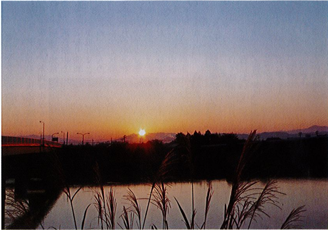
越後山脈から昇る朝日

中ノ口川、味方橋より見る越後山脈から昇る朝日です。日の出の凜とした強さと静寂さを狙い撮りました。