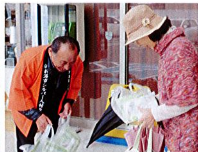
ウオロク松浜店にて(北)