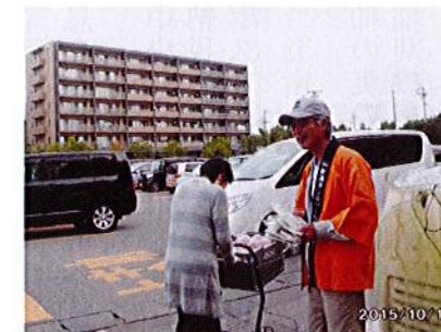
イオン新潟東店にて(東)