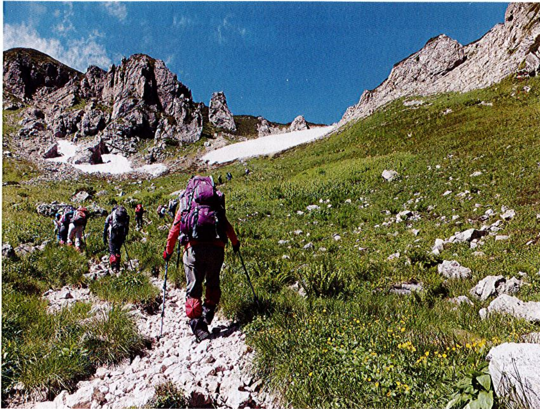
北アルプスの笠ヶ岳・杓子平