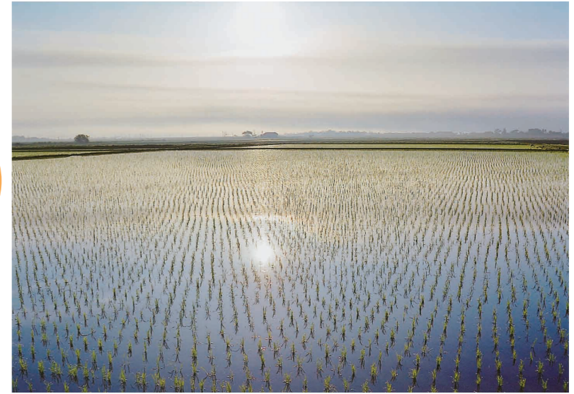
田園 陽光を浴び実りの秋へ