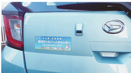
ステッカー貼付車