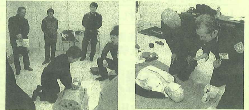
(3/12に開催予定だった安全講習会は、コロナウイルスの影響により中止となりました。)

津山市シルバー人材センター事務局会議室にて開催されました。参加者は20名でした。