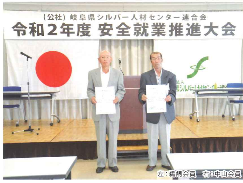
左：鵜飼会員 右：中山会員