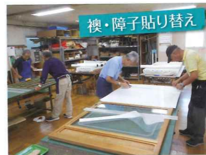
襖・障子貼り替え